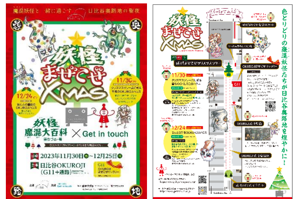
妖怪まぜこぜ Xmas 実施概要