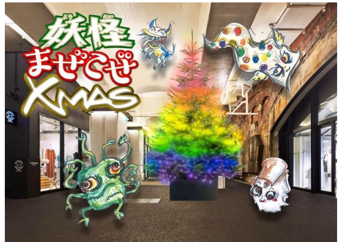
クリスマスツリーと展開イメージ

ホームページ： https://www.jrtk.jp/hibiya-okuroji/ インスタグラム： @hibiya_okuroji_official